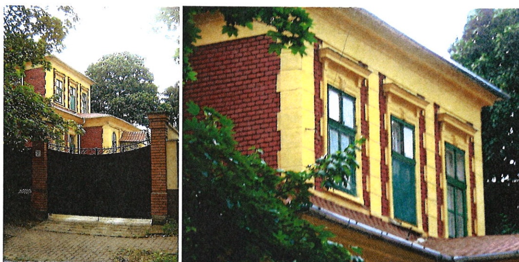
2.-3. sz. fotó: Az épület Vécsey köz felőli nézete és az emeleti szakasz részlete