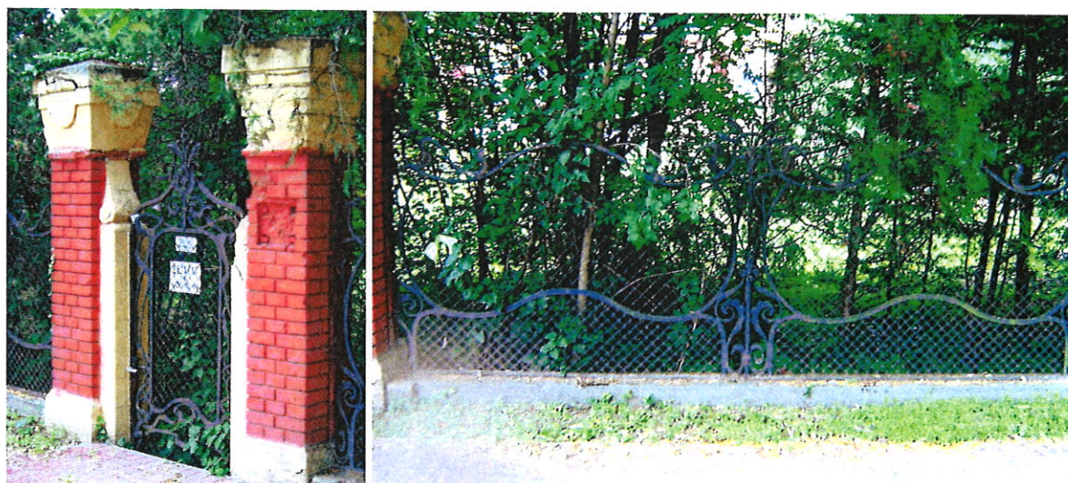
4.-5. sz. fotó: A Vécsey utcai szecessziós kerítéskapu és kerítésmező